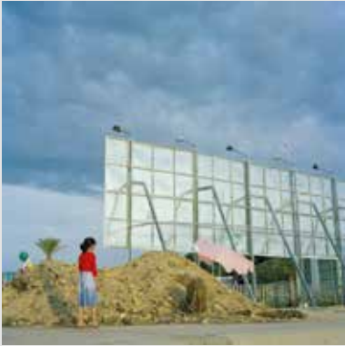
1_Série «Intersections» - (Photo de l'affiche)

Libres de droits, sur demande auprès de 2 e Bureau