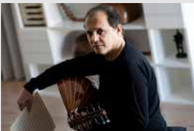
3_Anouar Brahem