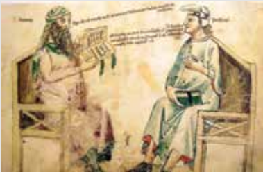
2_Averroës dialogue avec Porphyre Liber de herbis Monfredo de Monte Imperiali, Italie, XIV e siècle.