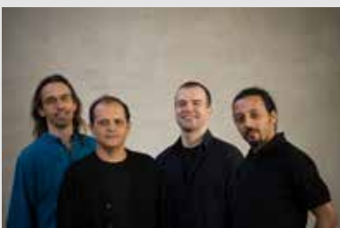
5_Anouar Brahem Quartet