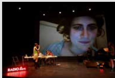
7_Radio Live-2 Radio Live : une émission de radio en trois dimensions imaginée par Aurélie Charon et Caroline Gillet