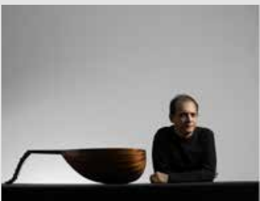
4_Anouar Brahem