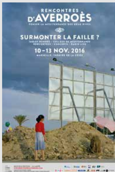
10_Affiche des Rencontres d'Averroës Graphisme Petroff Studio.